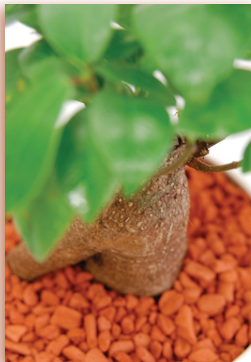
高性能セラミック用土採用で水管理らくらく